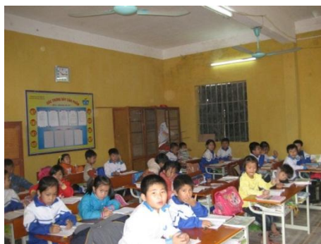
シフト制で学ばざるをえない子どもたち