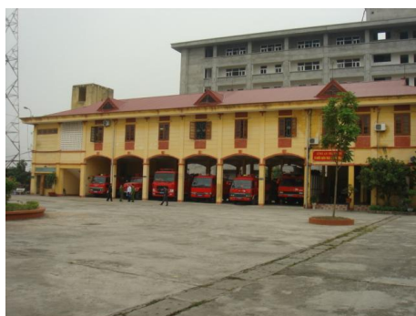
ハイズオン省消防