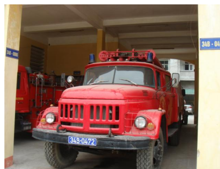
年式の古い現在使用中の消防車