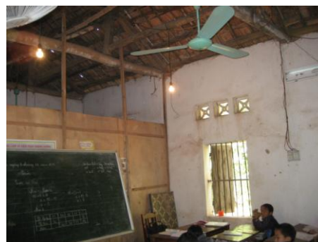
離れた敷地で借用している教室