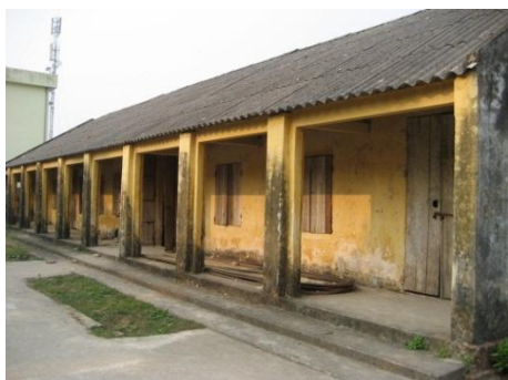
使用不可能な老朽化した校舎