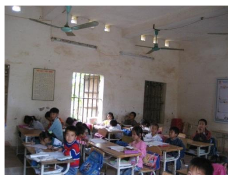
離れた敷地で借用している状態が悪い校舎と教室内