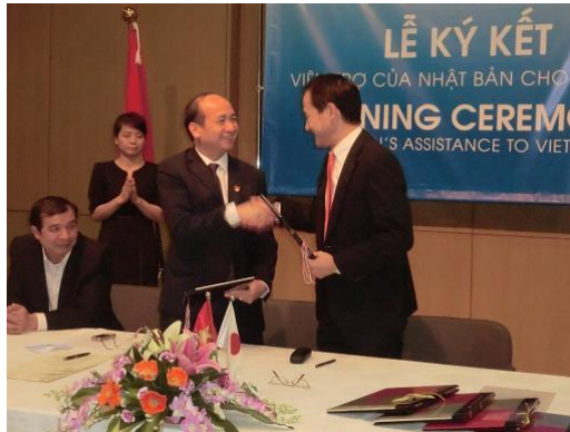
贈与契約書の署名と交換