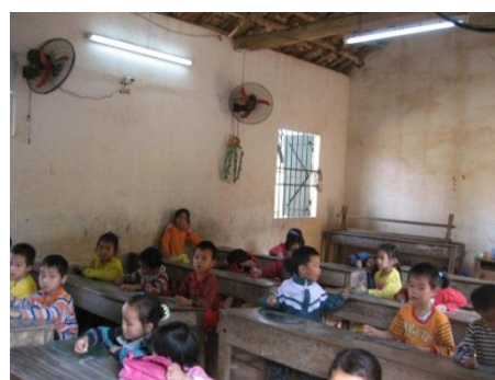
離れた敷地で借用している状態が悪い校舎と教室内