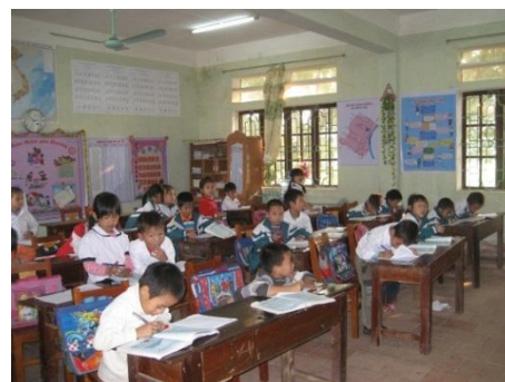
シフト制で学ばざるをえない子どもたち