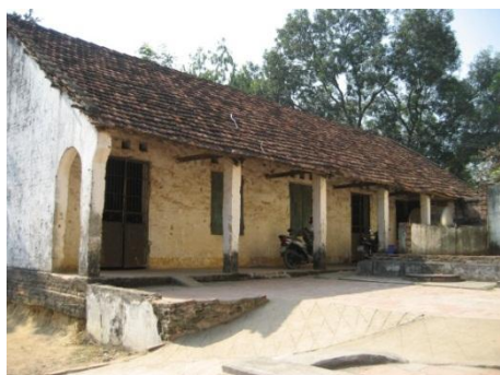
老朽化により使用不可能な校舎