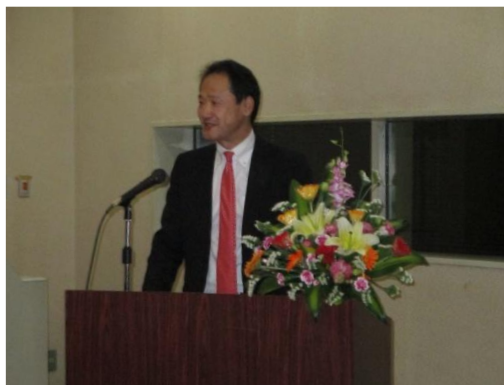
在ベトナム日本国大使館鈴木臨時代理大使のスピーチ