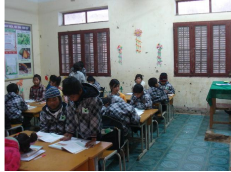
現在のバヴィ分校校舎とそこで学ぶ少数民族の子どもたち