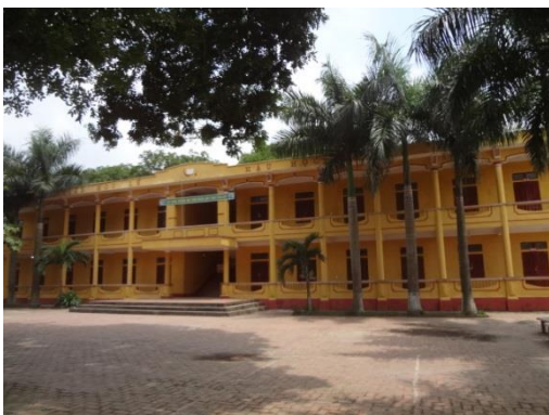
Khu nhà hiện tại