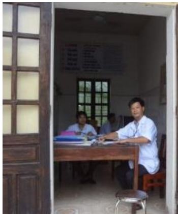
Y bác sĩ của trạm