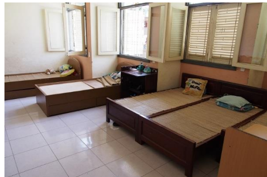
Phòng sinh hoạt của trẻ