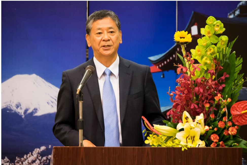
Đại sứ Fukuda phát biểu tại Lễ ký