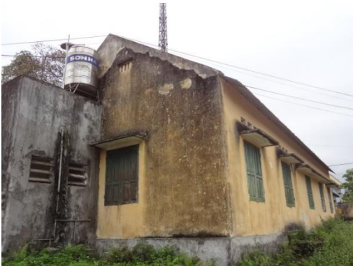
Khu nhà cũ