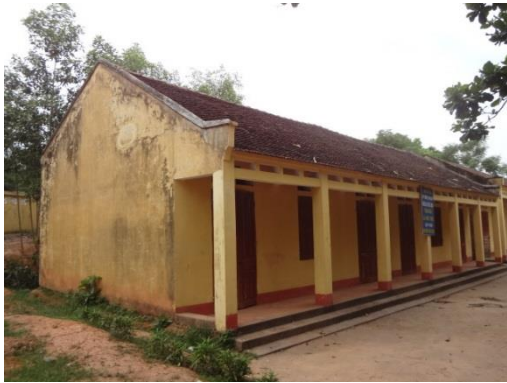
Khu nhà hiện tại