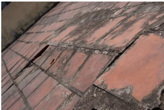
Hiện trạng trần nhà