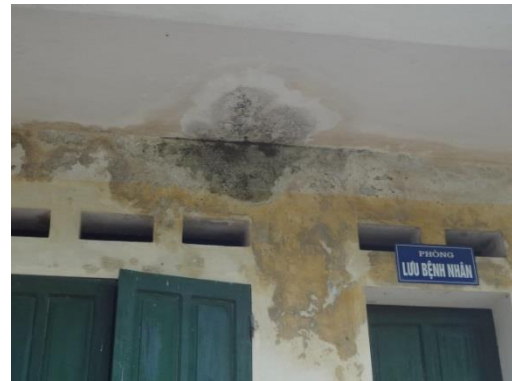
Trần, tường ẩm mốc