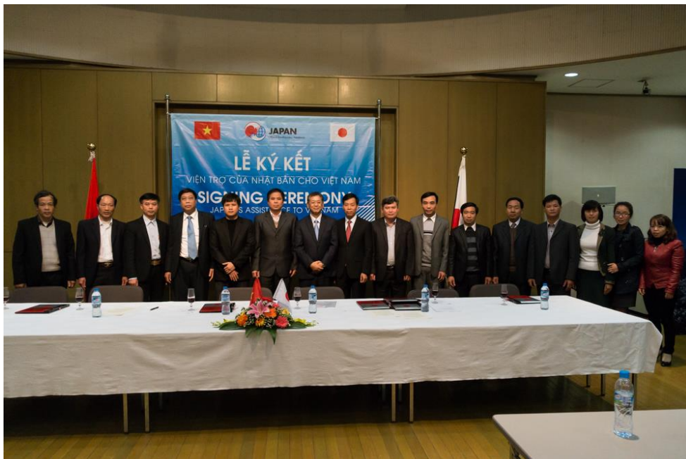
5 đơn vị nhận viện trợ chụp ảnh lưu niệm