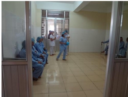
Bệnh nhân chờ phẫu thuật