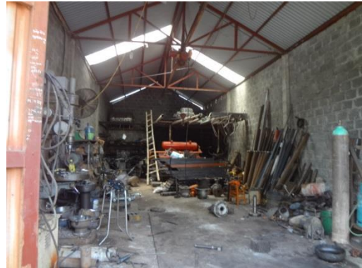
Kho máy móc thiết bị