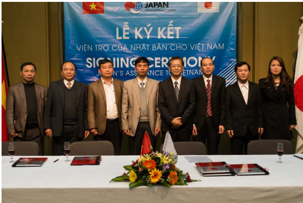
Các đơn vị nhận viện trợ chụp ảnh cùng Đại sứ