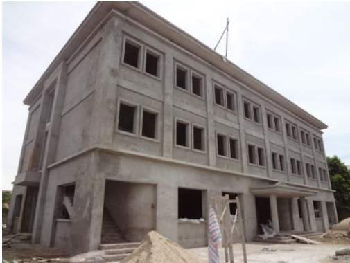
Khu nhà thực hành và ký túc xá