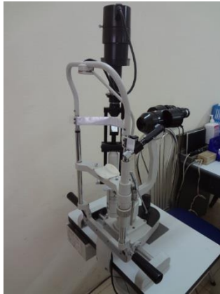
Thiết bị đang sử dụng