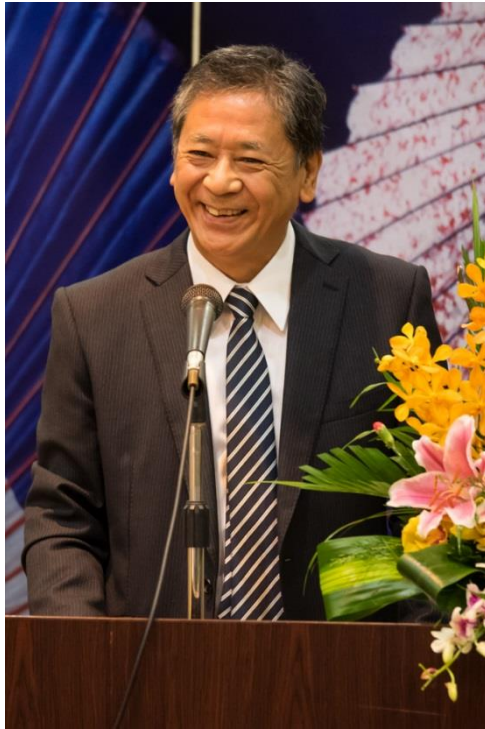
Đại sứ Fukada phát biểu