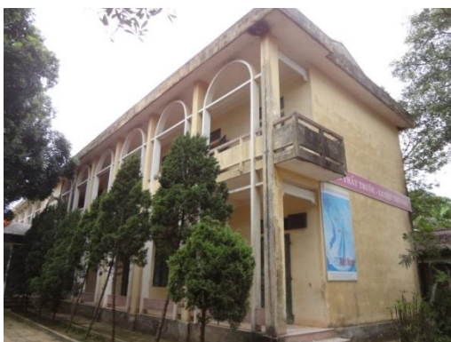
Khu nhà duy nhất