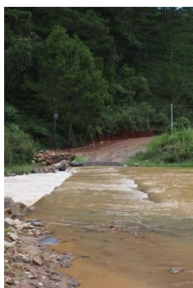
Đường đập tràn