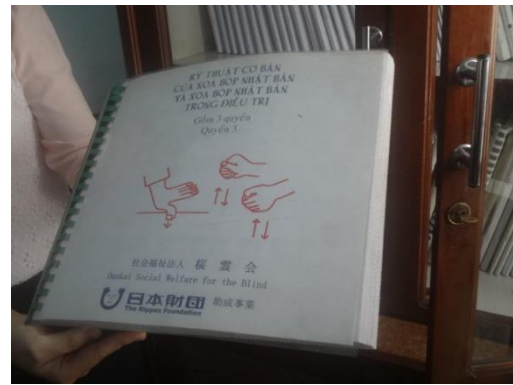
Sách dạy nghề bằng chữ nổi