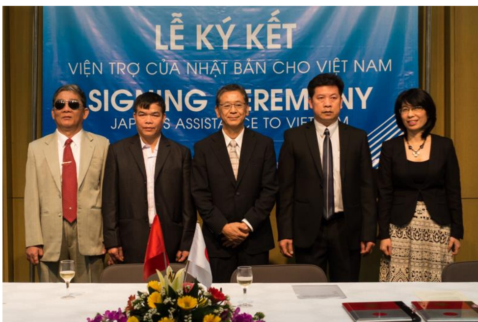
Đại sứ và đại diện các đơn vị nhận viện trợ