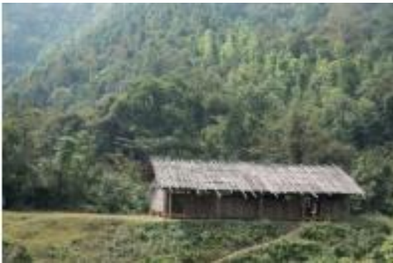
Khu nhà cũ