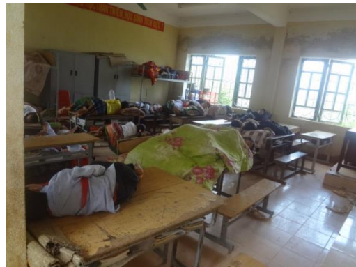
Học sinh ngủ trên bàn