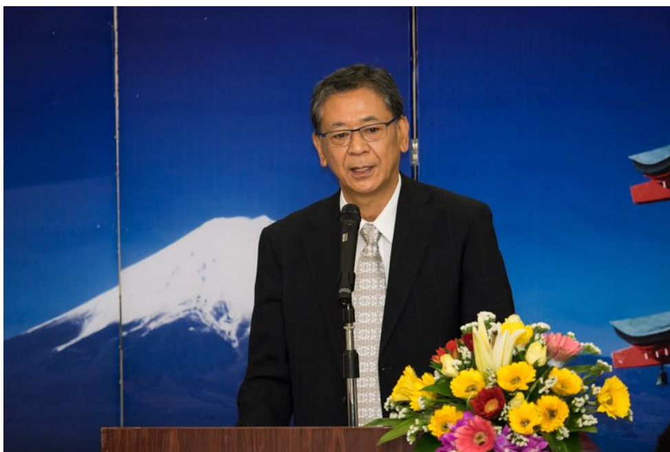
Đại sứ Fukada phát biểu