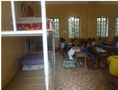
Giường tầng cuối phòng học