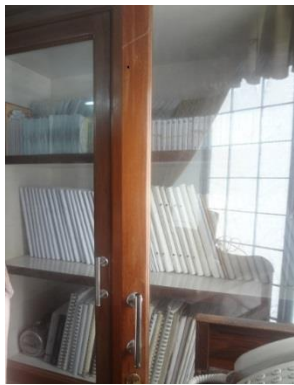
Tài liệu chữ nổi