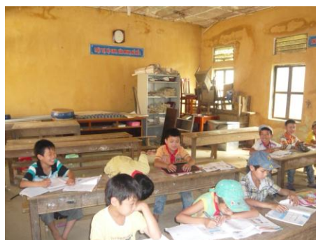
Phòng học tạm đã xuống cấp nghiêm trọng