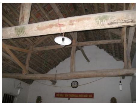
Phòng học đã xuống cấp không thể sử dụng