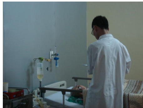
Phòng điều trị/phục hồi chức năng