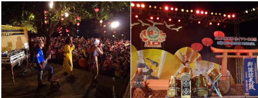
ホイアン日本祭り2012の様子。(左)DJ サムライのライブ(右)御諏訪太鼓