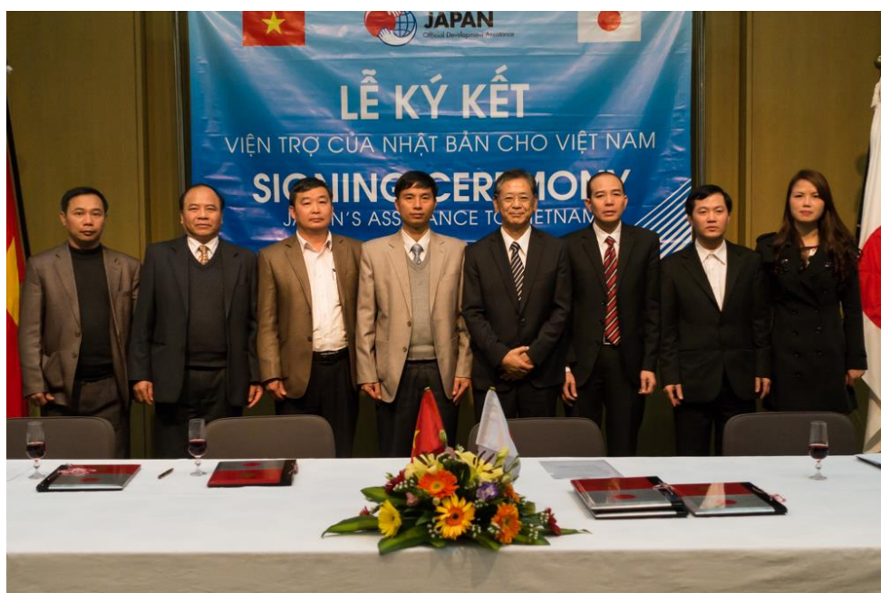
実施団体との記念撮影