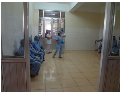
手術待ちの患者ら