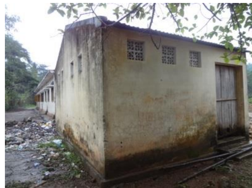
使用不能の小学校トイレ