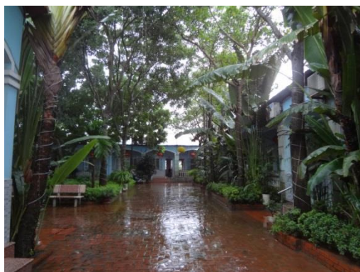
介護施設内に設けられた中庭

(2) フードン高齢者介護センターは 2006 年に開所し、現在は 60 才から 99 才までの 86 名の高齢者を受け入れているが、未だ十分な機材を有しておらず、入所する高齢者に対して適切な介護サービスを提供できていない。