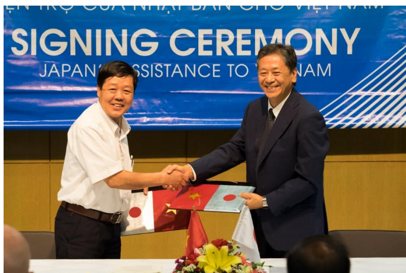
ホック・ホンチャウ村人民委員長と握手を交わす深田大使

4 署名式において、深田大使は「日本政府は20年以上に亘り、大規模インフラプロジェクト等によってベトナムの社会経済上の発展に貢献しています。国の発展には社会福祉の充実も同様に重要であり、教育や医療、衛生環境の改善に向けた今般の草の根無償資金協力を実施することで、人々の生活の質が向上することになれば幸いです。」と述べました。