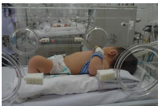
保育器中の新生児