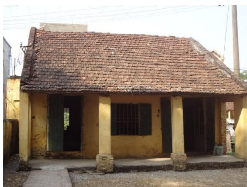
現在の校舎の一部