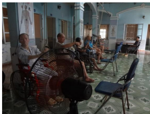
リハビリを行う入所者ら