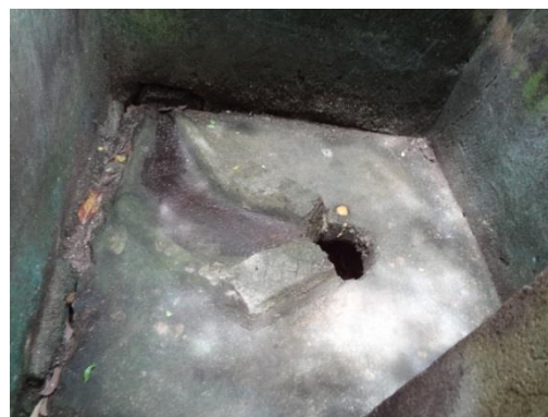
床面に設けられた穴