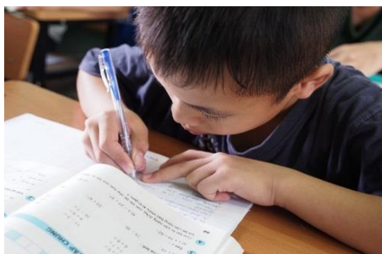
学習支援を受ける児童

(2) トゥイアン障がい児リハビリセンターでは、6 才から 18 才までの何らかの障がいを持った約 200 名の子どもたちを養育しているが、未だ十分な設備や機材の整備には至っていない。