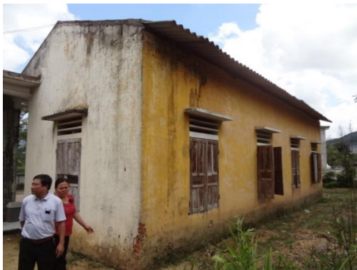
取壊し予定の診療棟