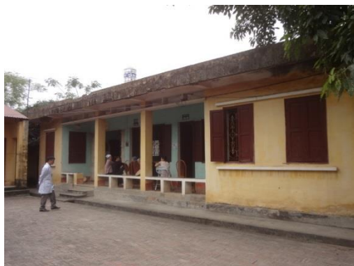
取壊し予定の診療棟