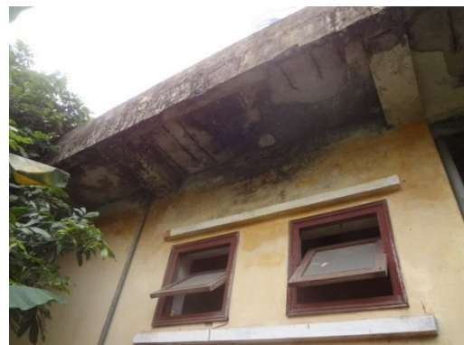
落下危険のある通路