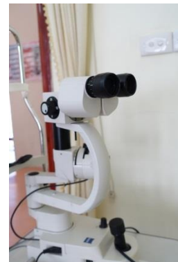
現在の機材の一部