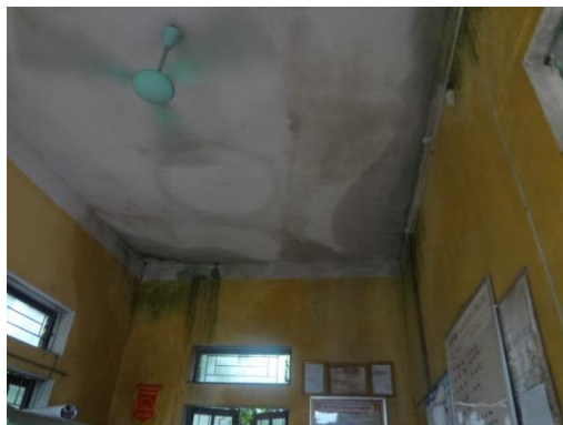
室内の漏水とカビの状況