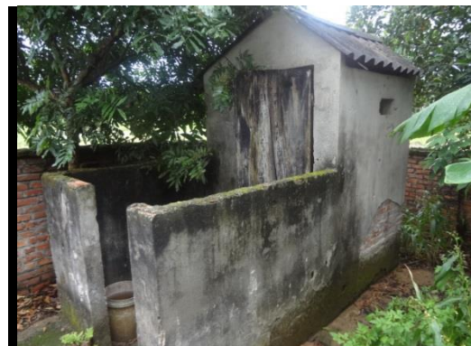
不衛生な屋外トイレ