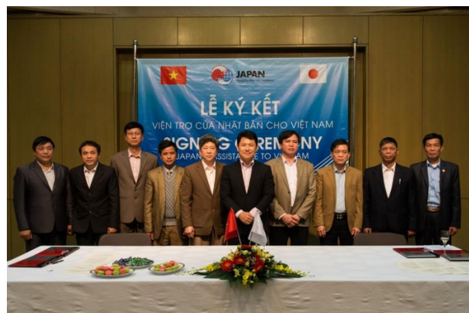
実施団体との記念撮影