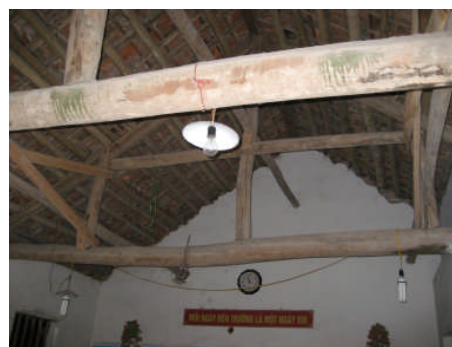
老朽化して使用不可能なバン村落の校舎