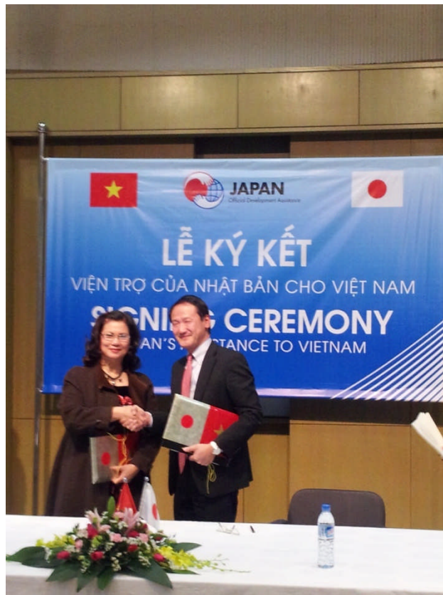
贈与契約書の署名と交換