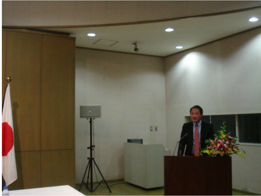
在ベトナム日本国大使館 鈴木公使のスピーチ