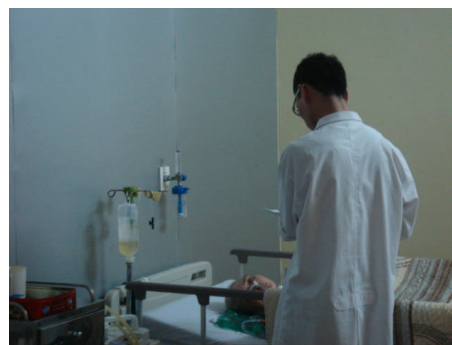
介護・リハビリの様子