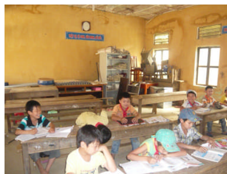
老朽化の進んだ危険な借用教室とそこで勉強する子どもたち